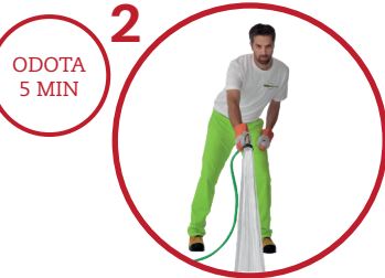
2 Puhdista kivetysalue suihkuttamalla