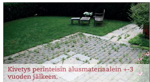
Kivetys perinteisin alusmateriaalein +3 vuoden jälkeen.

FescoLock S soveltuu pienen raekokonsa ansiosta alle 5mm saumoille.