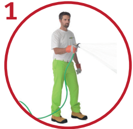
1 Kostuta pinta kevyesti