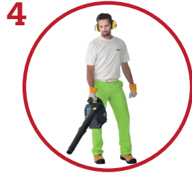
4 Harjaa tai puhalla pintapölyt pois

Suosittellemme käyttämään FescoLock L:n leveissä saumoissa kumivasaraa koneellisen tärytyksen sijasta kivien rikkoutumisvaarasta johtuen.