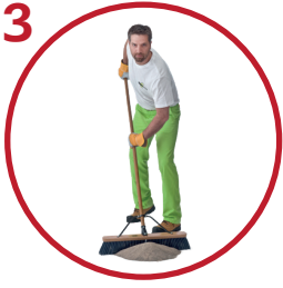
3 Lisää hiekkaa vajonneisiin saumoihin ja harjaa pinta