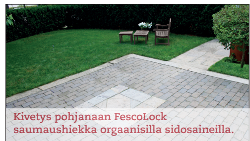
Kivetys pohjanaan FescoLock saumaushiekka orgaanisilla sidosaineilla.

FescoLock L soveltuu suuremman raekokonsa ansiosta leveämpiin kivetysten saumoihin, esimerkiksi liuskekivien saumoihin.