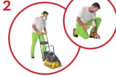
2 Tiivistä pinta