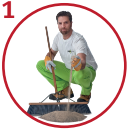
1 Levitä saumaushiekka